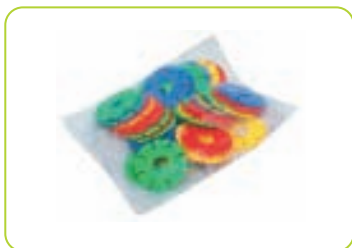
Presentación en Bolsa