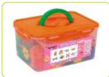
Presentación en Maletín