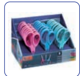
Expositor de 24 unidades de colores surtidos.