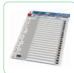
Presentación en blister